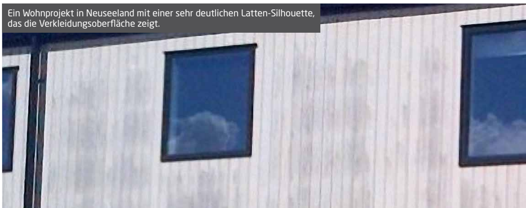
Ein Wohnprojekt in Neuseeland mit einer sehr deutlichen Latten-Silhouette, das die Verkleidungsfläche zeigt.

Weitere Informationen zur Bodenreinigung erhalten Sie bei Ihrem zuständigen Vertriebsmitarbeiter.